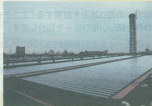
稲荷湯さんの屋上には約800本のソーラーパイプが!