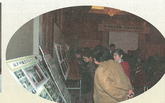
地域の環境写真展