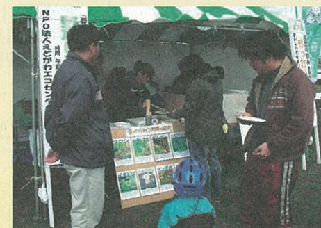
身近な野草を天ぷらにしておいしく食べたよ!