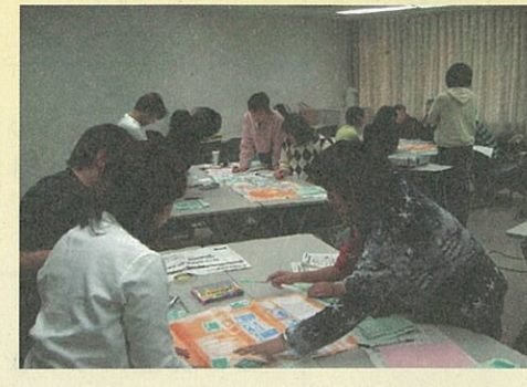
パート3 省エネゲームに奮闘中

チャレンジ講座 : 平成17年度 環境学習リーダー養成講座の修了生がグループごとに企画・運営・実施しました。