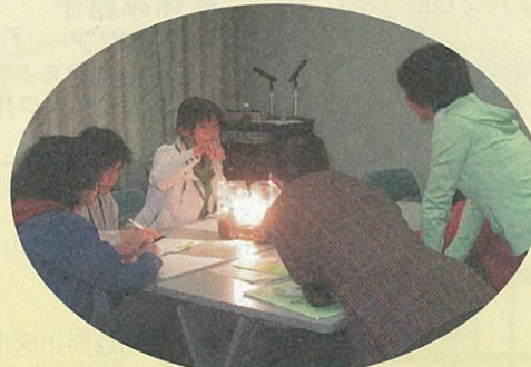
温暖化モデルの実験中