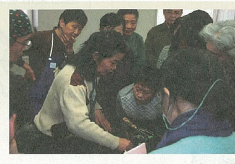
生ごみが堆肥に変身するぞ~!