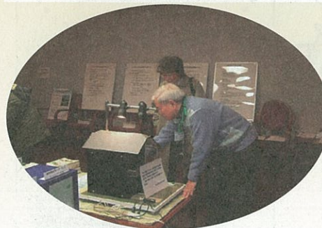
家の形をした太陽光発電の模型

チャレンジ講座 : 平成17年度 環境学習リーダー養成講座の修了生がグループごとに企画・運営・実施しました。