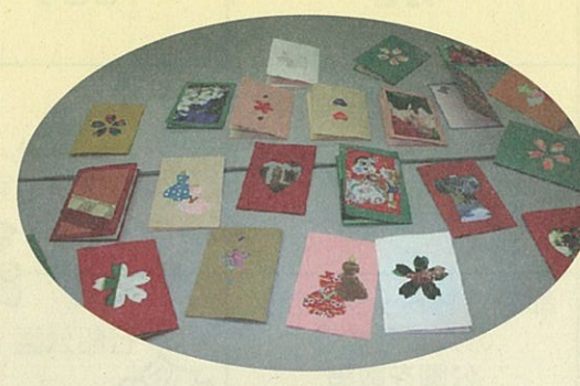
パート2 不用になった包装紙から素敵なカードができたよ!