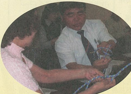
救急救命の実技やロープを使った講習