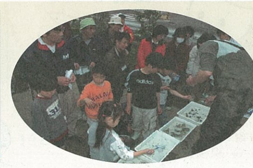
左近川の中には生き物がたくさん!

志は地球規模・行動は足元から : 地域に根ざした環境活動を実践されている方々のお話は説得力がありました。(2月25日)