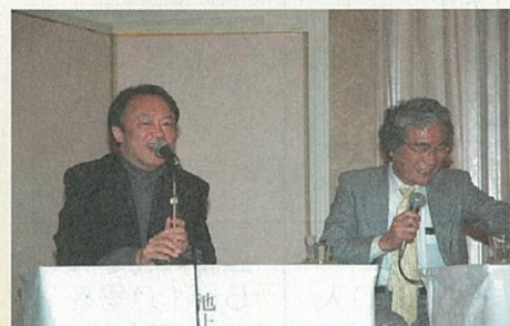
コーディネーターは池上 彰さん (元「週刊こどもニュース」のお父さん)

志は地球規模・行動は足元から : 地域に根ざした環境活動を実践されている方々のお話は説得力がありました。(2月25日)