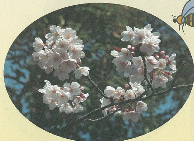
小松川境川親水公園の桜

今年の1月~2月は寒く、大雪になりました。植物・動物ともにひたすら寒さにたえてきたといえます。気温が13~14℃になると、植物の根は活動を始め、動物も活発になります。すべての生きものは生き、子孫を残すために春から初夏は多忙です。植物が種を实らすためには昆虫の力が必要で、それぞれ工夫をこらして昆虫を呼び寄せます。