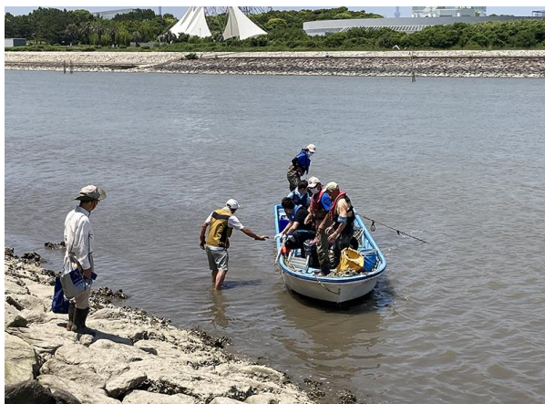
図 1 東なぎさに上陸。