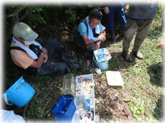
図5 底生動物の同定