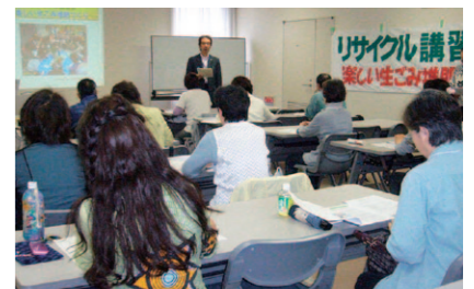
▲おきがる環境講座(もったいないカフェ) ▲楽しい生ごみ堆肥づくり講習会

各講座の修了後は、エコセンター会員やエコセンター団体会員の一人となって活躍している方も数多くいらっしゃいます。