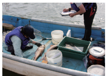
▲葛西沖の魚類調査のようす