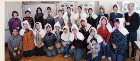
▲11/21上小岩小学校PTA成人委員会

簡単な手作り教室の後、エコについて楽しくおしゃべりする「手作り教室+井戸端会議」を行っています。防災頭巾、箸袋、キャンドル作り、ふろしき包み等があります。