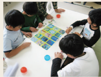
▲「E☆カプセル」のようす

【使用キット】①えこちよす(お買い物ゲーム) ②E☆カプセル(パズル) ③CO 2 バスケット(いすとりゲーム) ④節水大作戦(節水ゲーム) ⑤bidi:生物多様性(カード) ⑥ゼッター!! エコガイダー(DVD)