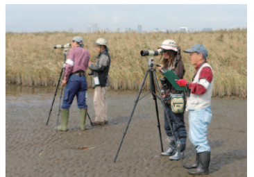
▲東なぎさの鳥類調査のようす