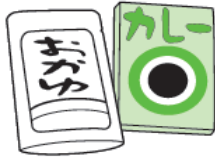
インスタント レトルト食品 (冷凍・冷蔵食品は除く)