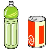
飲料 (アルコール類は除く)