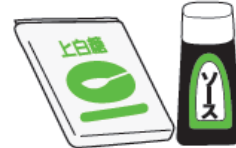
調味料 (砂糖、醤油など)