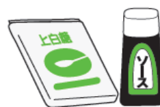
調味料 (砂糖、醤油など)