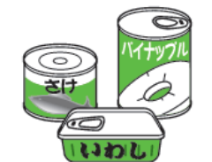
缶詰 (肉、魚、果物など)