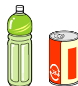
飲料 (アルコール類は除く)