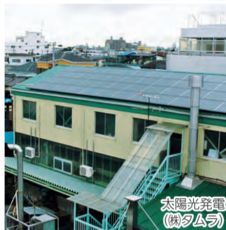
太陽光発電 (株)タムラ

えどがわエコセンターは、区民・事業者・行政が「連携」「協働」するパートナーシップの下、日本のエコタウンを目指してさまざまな環境問題に取り組んでいます。