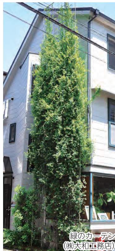
緑のカーテン (株)大和工務店