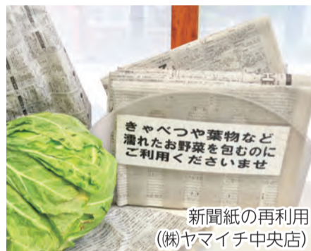
新聞紙の再利用 (株)ヤマイチ中央店